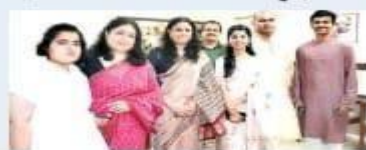
आज तक तीन चीतों ने लोहा धर