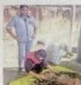
भारती कॉलेज की छात्राओं ने गीले कूड़े से खाद बनाकर पर्यावरण संरक्षण का संदेश दे रही हैं।