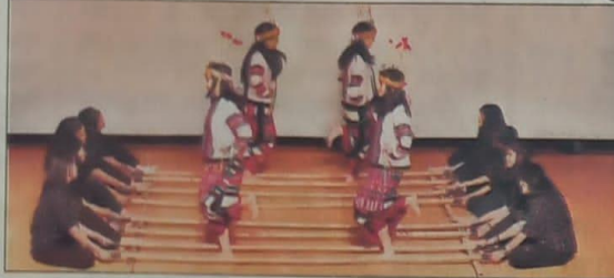
डीयू के संस्कृति परिषद की ओर से भारती कॉलेज में प्रस्तुतियां देती छात्राएं।

भारत-रूस के बीच संबंधों को लेकर भारती कॉलेज में जी20 शिखर सम्मेलन आयोजित