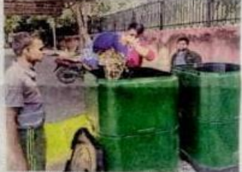
भारती कॉलेज की छात्राओं ने गीले कूड़े से खाद बनाकर पर्यावरण संरक्षण का संदेश दे रही हैं।

45 से 55 दिन का समय चाहिए और 30 किग्रा खाद बनाने में