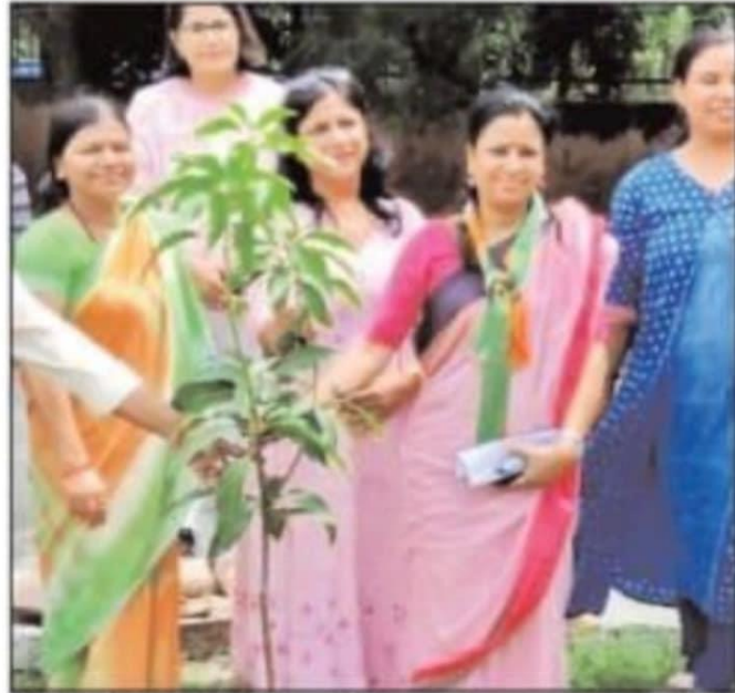
कॉलेज में पौधरोपण करती मुख्यअतिथि।